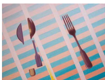
Pamięć, 2012, olej na płótnie