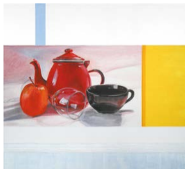
Co, Lewo!, 2014, olej na płótnie