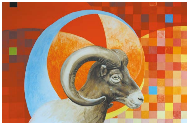
Ani wschód, ani zachód, 2017, olej na płótnie