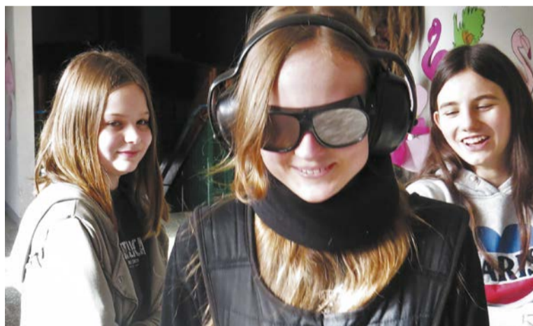
W projekt zaangażuje się około 400 uczennic i uczniów

Projekt realizowany będzie we współpracy ze Stowarzyszeniem Centrum Rozwoju Edukacji Obywatelskiej CREO. Czas trwania: 1,5 roku. W ramach przedsięwzięcia do końca przyszłego roku w gminach tworzących Stowarzyszenie Metropolia Poznań (SMP) powstanie 25 Szkolnych Klubów Młodego Obywatela. Kluby będą miały za zadanie zachęcać młodzież ze szkół podstawowych i średnich do zaangażowania społecznego i obywatelskiego. Prowadzić je będą odpowiednio przeszkoleni nauczyciele-opiekunowie. W każdym klubie grupa kilkunastu uczniów i uczennic w pierwszej kolejności przejdzie cykl warsztatów prowadzonych przez wykwalifikowanych trenerów. W ich trakcie młodzi obywatele założą „skafander starości” i poznają życie seniorów, zobaczą świat z poziomu osoby na wózku, nauczą się planować proste projekty młodzieżowe i wspólnie ustalić zasady tzw. Szkolnego Budżetu Obywatelskiego. Po cyklu warsztatowym klubowicze przystąpią do działania. W każdej ze szkół młodzi wolontariusze zorganizują po trzy inicjatywy przy wsparciu mentoringowym tzw. animatorów obywatelskich. Planowane akcje, bazujące zawsze na pomysłach osób młodych, dotyczyć będą inicjatyw wolontariackich na rzecz seniorów, osób