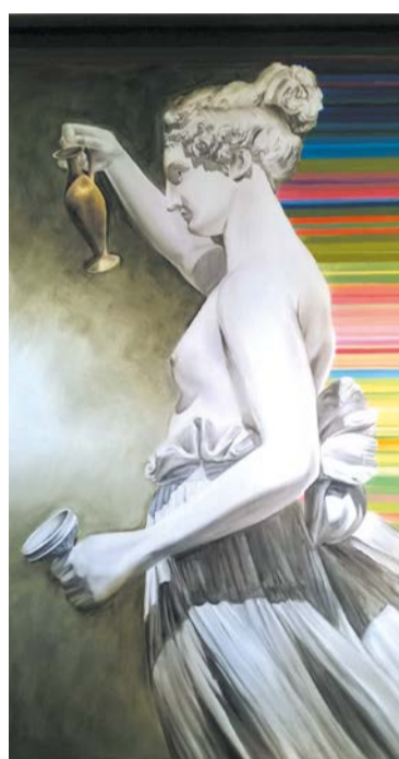
Hebe, 2019, olej na płótnie