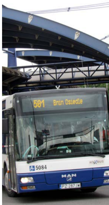
Autobus linii 501 od 1 sierpnia jeździ do gminy Kórnik

Inny mieszkaniec, który korzysta z komunikacji zbiorowej sporadycznie, kasuje bilety jednorazowe. Jadąc z Kórnika i podróżując po Poznaniu, kupował bilet za 6,30 zł