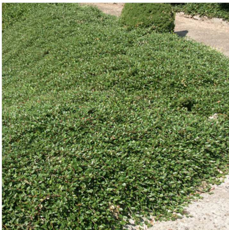
Irga dammera 'Major' Cotoneaster dammeri 'Major'