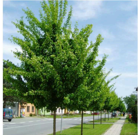
Klon Polny (Paklon) Acer compestre