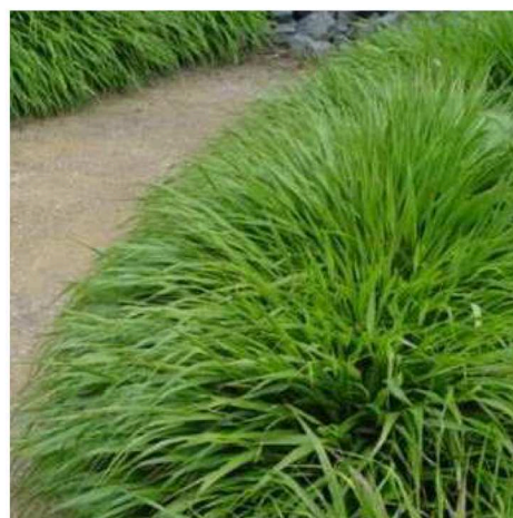
Hakonechloa macra 'Albostriata'