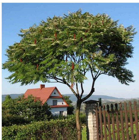
Sumak octowiec 'Dissecta' Rhus typhina 'Dissecta'