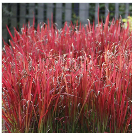
Imperata Cylindrica 'Red Baron'