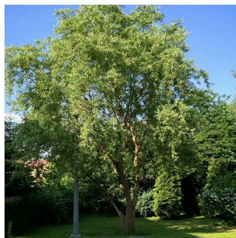
Wierzba babilońska 'Tortuosa' Salix babylonica 'Tortuosa'