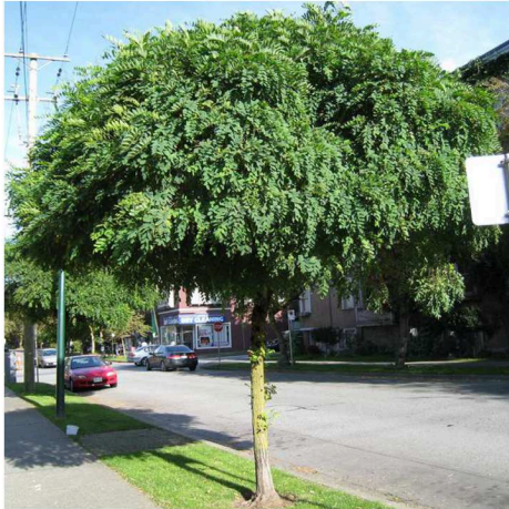
Robinia akacyjowa "Umbraculifera" Robinia pseudoacacia "Umbraculifera"